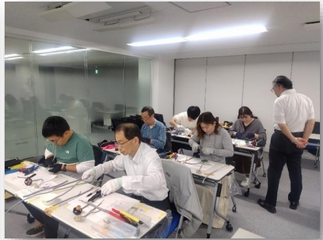
能講座カリキュラム